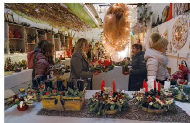
Im November fand die Veranstaltung „Das BBZ leuchtet“ statt.

Gleichzeitig bleibt die große Herausforderung bestehen, dieses Angebot zu auskömmlichen Preisen mit den Kostenträger*innen zu verhandeln.