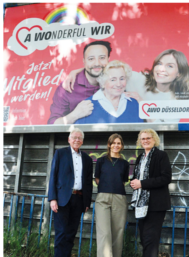
Eines der Großflächen-Plakate hing direkt neben der AWO-Zentrale an der Münsterstraße.

Um auch die AWO Düsseldorf als Mitgliederverband weiter für die Zukunft aufzustellen, wurde die in 2023 erfolgreich ins Leben gerufene Fachkräftekampagne „A WONderful Job“ zur Mitgliederkampagne „A WONderful WIR“ weiterentwickelt und gelauncht. Beide Kampagnen werden durch die AWO Sozialstiftung unterstützt und laufend fortgeführt.