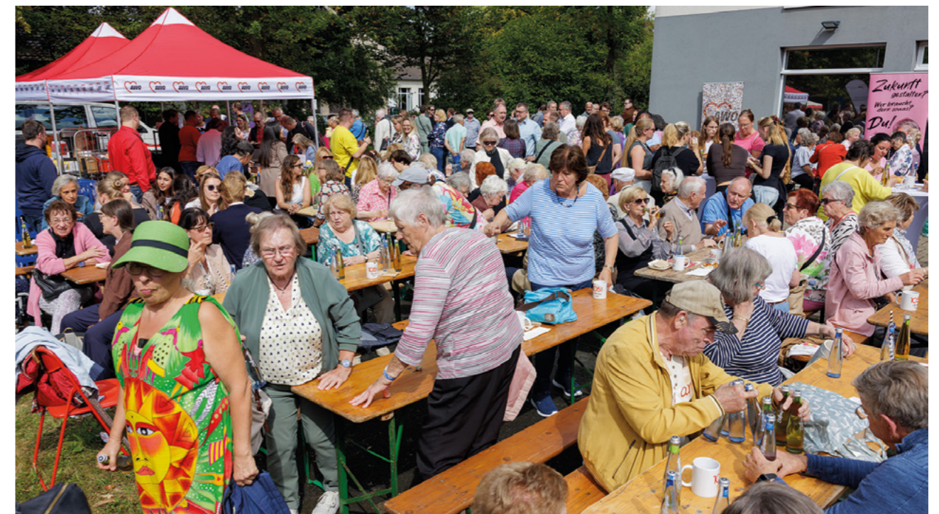
Über 800 Menschen feierten auf dem AWO-Gelände an der Schloßallee das 105-jährige Jubiläum.

Neben dem 105-jährigen Bestehen feierte der Kreisverband ein weiteres besonderes Jubiläum: Das Maria-Nitzschke-Haus, heute Hauptsitz des Kreisverbandes, feierte 60-jähriges Jubiläum. Das damals als Sozialhaus ins Leben gerufene Haus zählte seinerzeit zu den fortschrittlichsten sozialen Einrichtungen Düsseldorfs. Das Jubiläum wurde gemeinsam mit der im Haus ansässigen Erziehungsberatung Derendorf gefeiert, die ebenfalls 60. Geburtstag feierte.