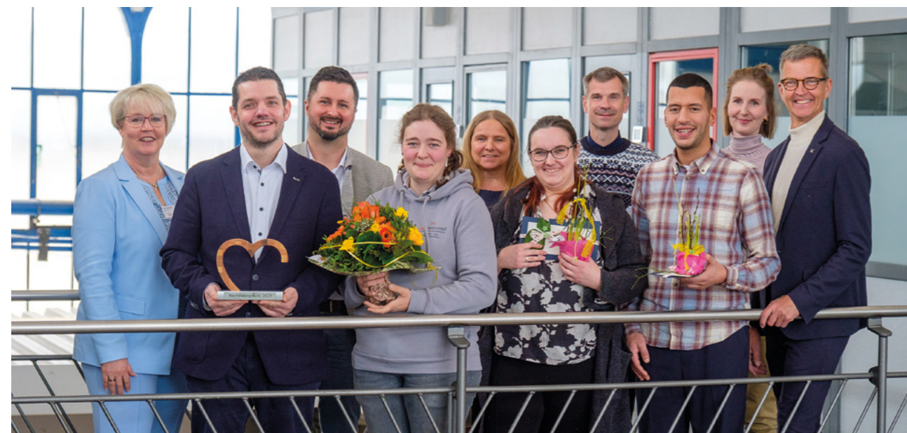
Das Ausbildungsherz ging in 2025 an das Unternehmen „Raumkonzept Grunwald“. Das jährlich vergebene Ausbildungsherz würdigt Firmen, die sich besonders für die Förderung der beruflichen Entwicklung junger Menschen einsetzen.