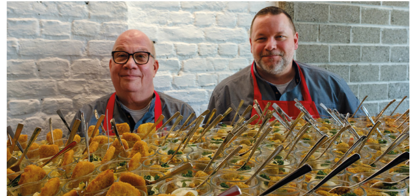
Einer der Geschäftsbereiche der AWO.DUS ist die „Zentralküche“.

Der Bereich „Reinigung“, der im Jahr 2022 gegründet wurde, verantwortet die Flächenpflege der rund 160 Einrichtungen der AWO Düsseldorf und trägt damit wesentlich zur Qualitätssiche-