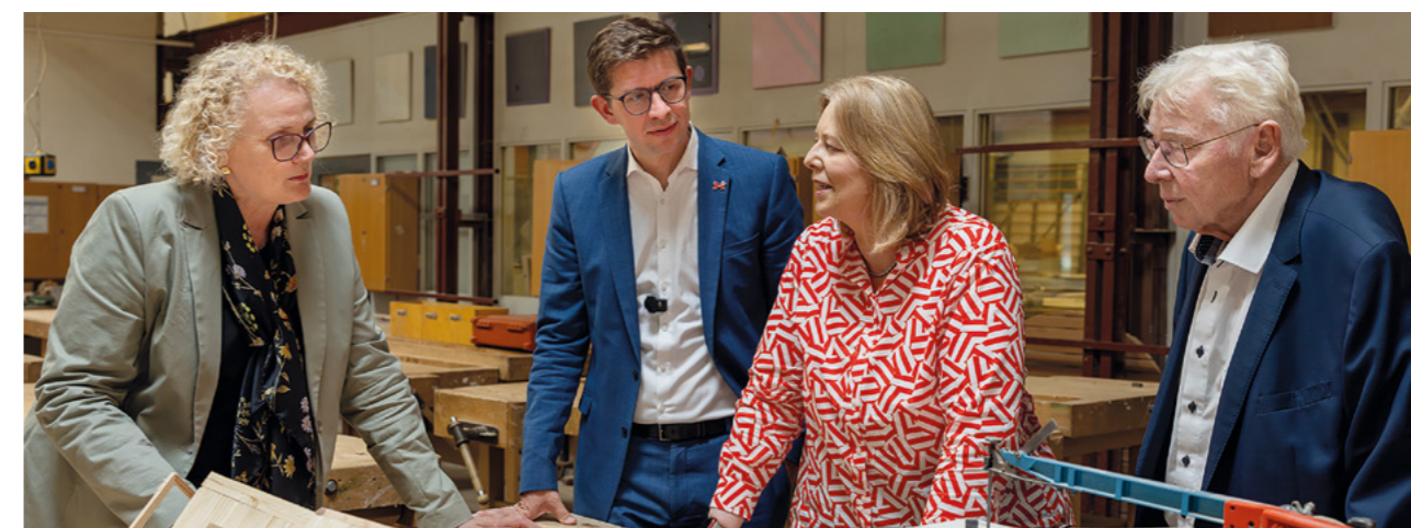
Bundesarbeitsministerin Bärbel Bas informierte sich über die Projekte und Angebote des BBZ.

Das AWO Berufsbildungszentrum gGmbH hat mit der Erweiterung des Geschäftsfeldes „Eingliederungshilfe – Inklusionshelfer*innen an Schulen“ das Portfolio vergrößert und konnte somit das Angebot am Standort Schule weiter ausbauen: Offene Ganztagschule (OGS), Schulsozialarbeit und Schulbegleitung – alles aus einer Hand.